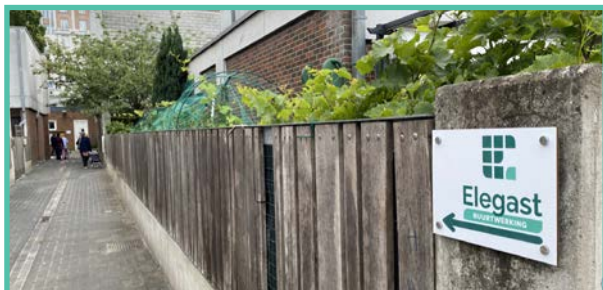
Twee Netenstraat 13A 03 232 60 20 buurtwerking@elegast.be